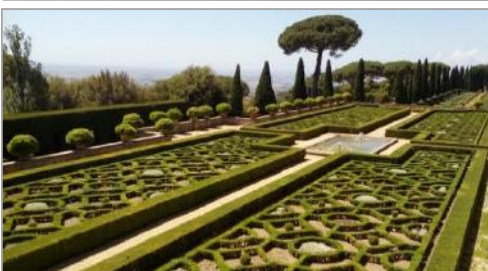
Les jardins Barberini à Castel Gandolfo

MMI organise aussi, avec les secrétaires générales et les archivistes générales, une sortie annuelle pour les membres des congrégations qui en font partie. Cette année, la sortie était le 13 mai à Castel Gandolfo. Puisque le Pape François n'utilise pas le palais pontifical d'été de Castel Gandolfo, le château avec le jardin de 22 hectares est désormais ouvert au public. Ce fut pour nous une belle journée bien que fatigante. Nous avons passé la matinée à Frascati (une des