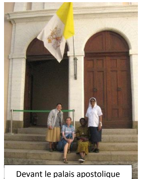
Devant le palais apostolique

MMI organise aussi, avec les secrétaires générales et les archivistes générales, une sortie annuelle pour les membres des congrégations qui en font partie. Cette année, la sortie était le 13 mai à Castel Gandolfo. Puisque le Pape François n'utilise pas le palais pontifical d'été de Castel Gandolfo, le château avec le jardin de 22 hectares est désormais ouvert au public. Ce fut pour nous une belle journée bien que fatigante. Nous avons passé la matinée à Frascati (une des